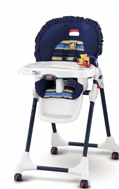
Silla Alta Healthy Care™